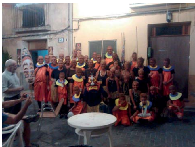
1 er premio disfraces